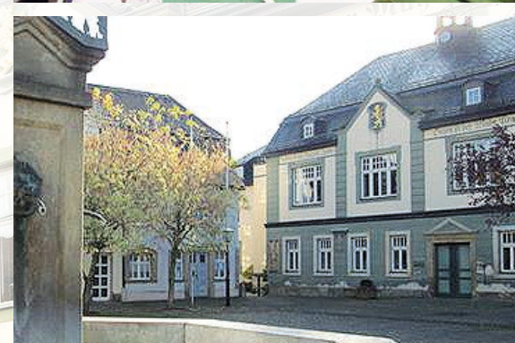
Markt Bad Blankenburg und Sitz des Kunstkreises